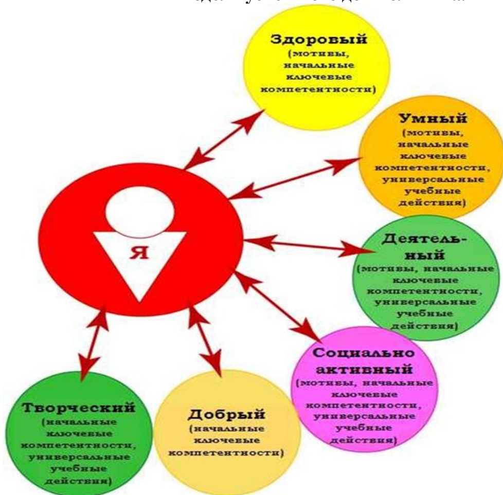
Модель успешного дошкольника.